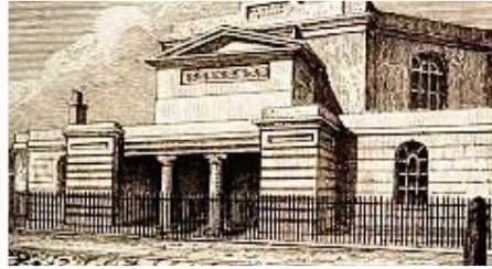
Capel Old Jewry 1808 – 1846 yn Jewin Street, Llundain